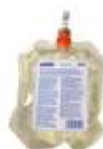
Carga de fragancia